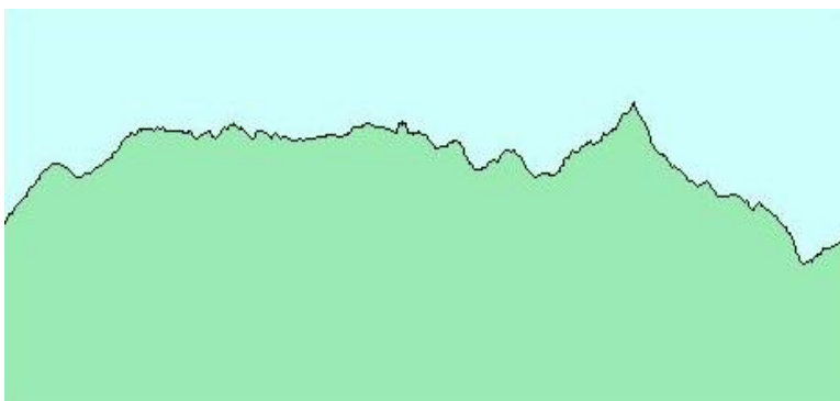
Perfil ruta dels Dolmens